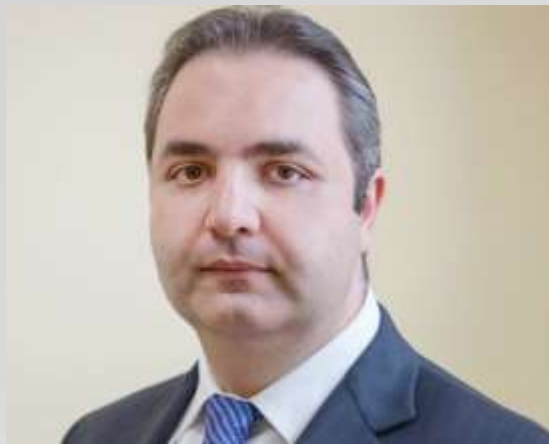
Заместитель Министра промышленности и торговли Российской Федерации Г.В. Каламанов

«Утверждённый постановлением Правительства № 961 механизм разработан Минпромторгом России в целях поддержки российских экспортёров промышленной продукции военного назначения, путём возмещения части затрат на уплату процентов по кредитам, полученным в российских кредитных организациях и в ГК Внешэкономбанк, для возможности снижения процентных ставок по кредитам в отношении организаций, осуществляющих экспорт продукции военного назначения.